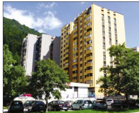
Zunanji izgled fasade na Cesti maršala Tita 45 pred sanacijo in po njej.

se je na podlagi metode zbiranja ponudb izbral najugodnejši izvajalec, s katerim je dogovorjeno obročno odplačevanje. Slednje je ob tako velikem finančnem zalogaju vsekakor zelo pomembno, saj se finančna obremenitev družinskih proračunov razdeli na daljše obdobje in s tem razbremeni.