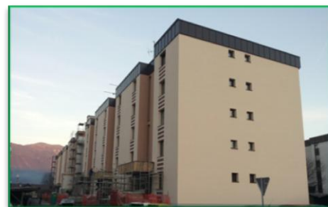
Do danes smo uspešno sanirali več kot 70% ovojev stavb, s katerimi upravljamo.

Za dodatne informacije, povpraševanje ali naročilo nas lahko kadar koli pokličite na telefonsko številko 04/ 581 26 00 ali pišite na elektronski naslov info@dominvest.si .